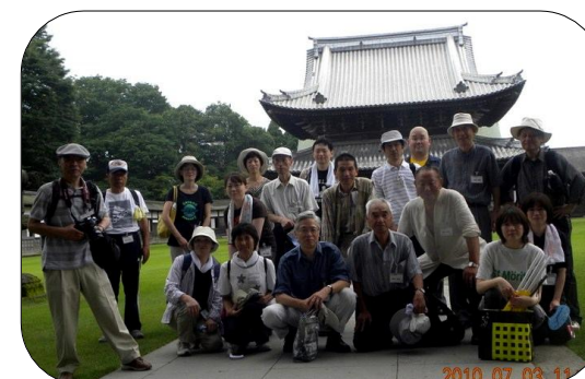
お寺の門をバックにパチリ☆