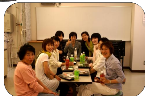
美味しかったですよ(笑)