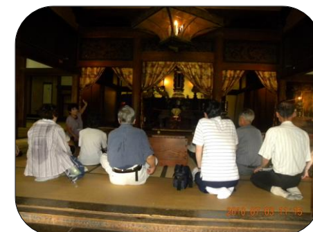
瑞龍寺の本堂にて 後ろ姿ですが誰でしょう?