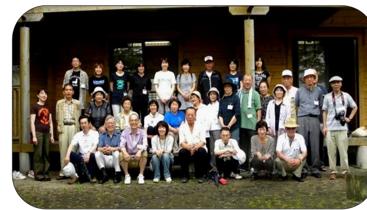
皆さんで記念撮影