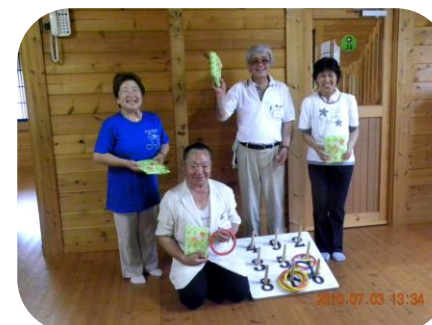
ゲームで景品ゲット♪