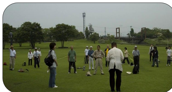
ウォーキングの前に・・・

おとぎの森公園内を散歩コース 公園内で綺麗なランや草花の観賞、 写真撮影をして楽しみました