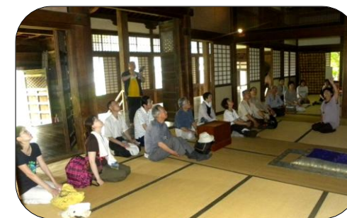
説明を熱心に聞いてます