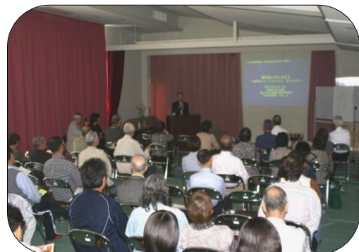
熱心に聞き入る参加者の皆さん