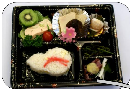
昼食に出された『ヘルシー食』